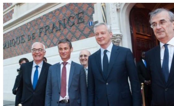
Bruno Le Maire, Ministre de l'Economie et des Finances, inaugure Citéco, la Cité de l'Economie et de la monnaie à Paris, en présence de François Villeroy de Galhau, gouverneur de la Banque de France.