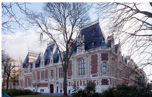
Cité de l'Économie et de la Monnaie, Paris 17 ème Ateliers LION, Eric PALLOT

La Banque de France a fait appel au groupement Ateliers LION, Éric PALLOT (ACMH), et IGREC INGENIERIE pour la transformation de l'Hôtel Gaillard, classé Monument Historique, en Cité de l'Économie. Ce musée comprend des salles d'expositions permanentes et temporaires, un amphithéâtre de 100 places, une bibliothèque axée sur la pédagogie de l'économie, des ateliers éducatifs et les locaux de logistique administrative et technique. IGREC INGENIERIE, BET TCE, a assuré la Direction de travaux ainsi que les missions Synthèse et OPC sur ce projet d'envergure. Le coût des travaux est de 31 500 000 € HT pour une surface de 7 500 m 2 .