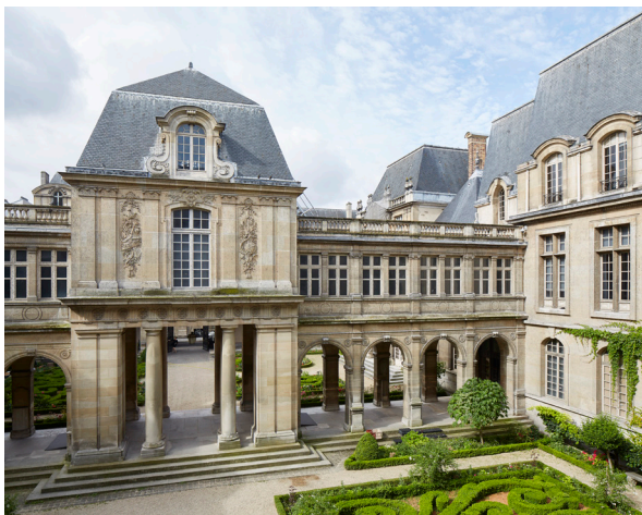
Musée Carnavalet, Paris 3 ème FRANCOIS CHATILLON Architecte

Aux côtés de l'architecte François CHATILLON et de l'agence norvégienne SNØHETTA, IGREC INGENIERIE intervient en tant que BET TCE, OPC et CSSI sur cette opération dont le montant des travaux s'élève à 22 000 000 € HT. Elle a pour objectif l'amélioration fonctionnelle, muséographique et architecturale, ainsi que la mise aux normes techniques du musée y compris l'accessibilité pour tous. La modernisation du parcours de visite, la restructuration des lieux d'accueil du public et du personnel ainsi que l'optimisation des espaces de réserves font partie du programme. Par ailleurs, des espaces dédiés aux expositions temporaires et des lieux privatisables sont créés.