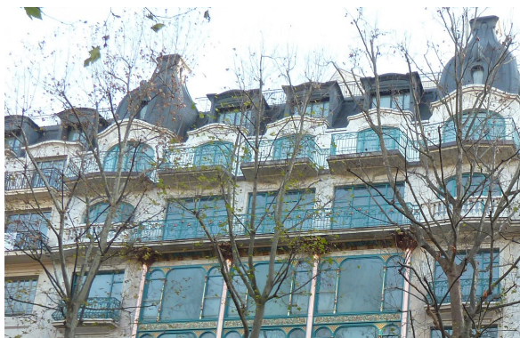
Capucines Daunou - Hôtel 5*, Paris 2 ème Agence B&B (Frédéric BOURSTIN)

IGREC INGENIERIE accompagne l'Agence B&B sur la transformation d'un ensemble immobilier, précédemment à usage de bureaux, de commerces et de logements, en hôtel 5 étoiles de 150 clés comprenant des restaurants, bar, salle de bal, salles de réunion, spa, fitness et piscine, services et back office. Le projet met en valeur la façade classée sur le boulevard des Capucines de l'ancienne « Samaritaine de luxe ». Sur ce projet prestigieux pour Vinci Immobilier Promotion - dont la conception est réalisée sous maquette numérique - IGREC INGENIERIE s'inscrit en tant qu'ingénierie fluides/électricité.