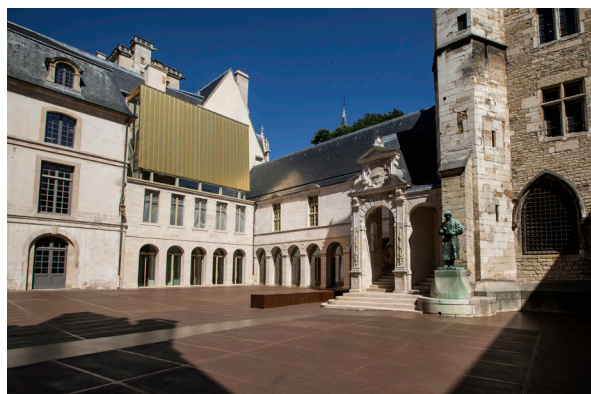
Musée des Beaux-Arts de Dijon Ateliers LION, Eric PALLOT

Le Musée des Beaux-Arts de Dijon a été fondé en 1797 dans le Palais des Ducs et États de Bourgogne. Il a bénéficié d'une rénovation de grande ampleur qui a duré quinze ans sous la direction des Ateliers LION et de l'architecte en chef des monuments historiques Eric PALLOT. IGREC INGENIERIE est intervenue en tant que BET TCE, économiste, CSSI, Synthèse et a assuré la Direction des travaux. L'opération de 26 000 000 € HT a consisté en une rénovation générale. Le musée rénové offre 4 200 m 2 d'exposition sur un parcours chronologique, de l'Antiquité au XXI ème siècle.