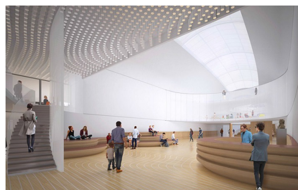
Musée National de la Marine, Paris 16 ème H2O Architecte, SNOHETTA

C'est avec H2O Architecte et SNØHETTA qu'IGREC INGENIERIE participe à la rénovation et à la restructuration du Musée National de la Marine. IGREC INGENIERIE intervient comme BET fluides, exploitation-maintenance, CSSI et HQE. Le montant des travaux du projet s'élève à 20 000 000 € HT. La consultation des entreprises devrait intervenir à l'été 2019.