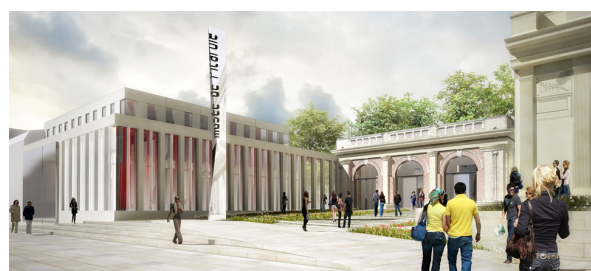
Musée de Picardie, Amiens (80) FRENAK & JULLIEN Architecte

Construit en 1867, le Musée de Picardie, véritable palais de l'archéologie et des arts, participe à l'émergence des lieux muséographiques français. L'agence FRENAK & JULLIEN et IGREC INGENIERIE, BET TCE, CSSI sur ce projet, ont pour mission d'améliorer l'attractivité du musée et de le rendre accessible à tous. L'ensemble sera livré fin 2019 pour un montant de travaux de 16 550 000 € HT.